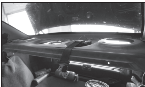
3. Полученный результат.