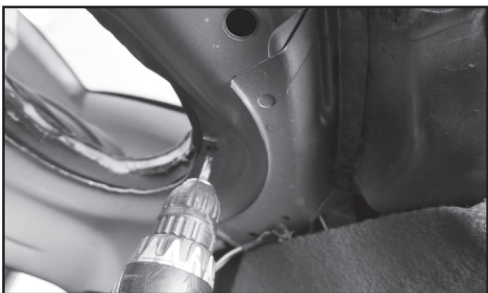
7. Прикручиваем полку сквозь металл саморезами по металлу 3,5x25 (4 шт.) в 4-х местах.