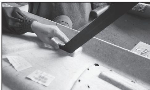
2. Вытаскиваем ремень безопасности из пластмассовой полки.