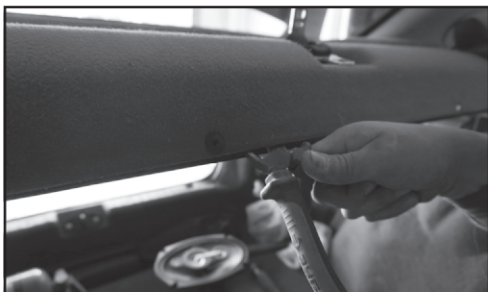
1. Снимаем клипсы крепления полки с помощью кусачек.