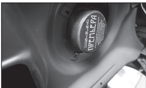
10. Если магнит динамика большой и задевает за металл, приходится распиливать металл.