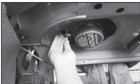
9. Подключаем динамики к проводам.