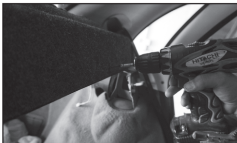
6. Прикручиваем полку саморезами по металлу 3,5 x 25 (3 шт.) по краям и в центре.