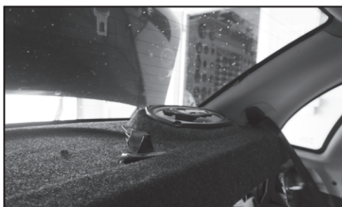
11. Полученный результат.

Необходимый крепеж: саморезы по металлу 3,5 x 25 – 7 шт. саморезы 3,5 x 25 – 8 шт.