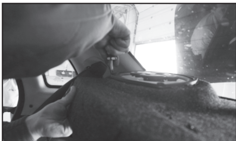
8. Прикручиваем маленький отворот колонки к полке саморезами 3,5 x 25 (8 шт.)